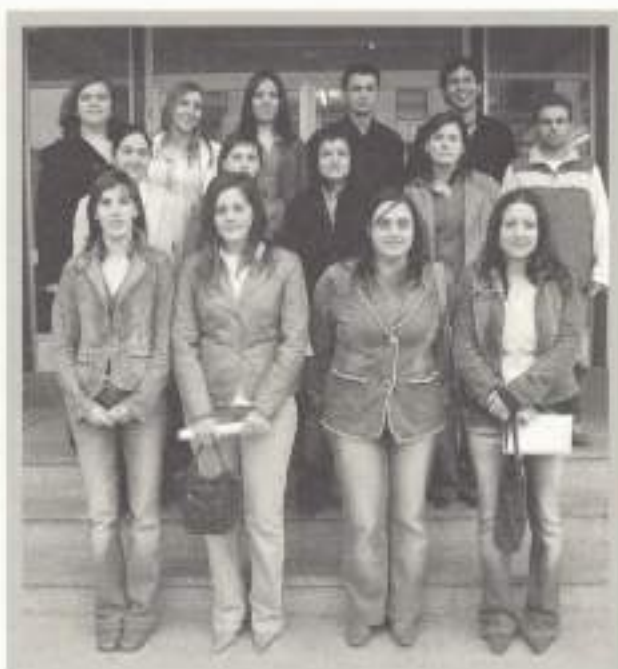
Prevención de Riesgos Profesionales.