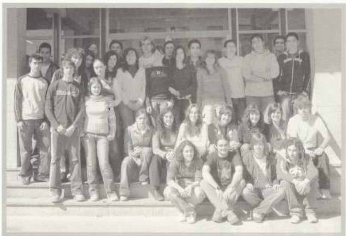
2º C Bachillerato.