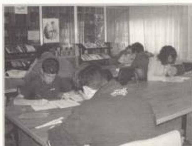
Maratón Harry Potter.