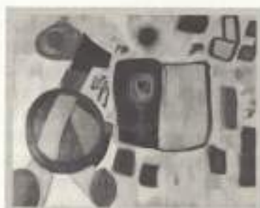
Tenis de mesa - Museo Pecharrroman - Pasaron de la Vega - Cáceres

Cada jugador recibe cinco servicios y, cuando los oponentes cambian sus posiciones, sirve durante cinco puntos.