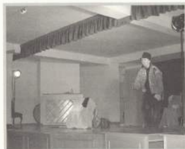
Cuentacuentos en inglés.