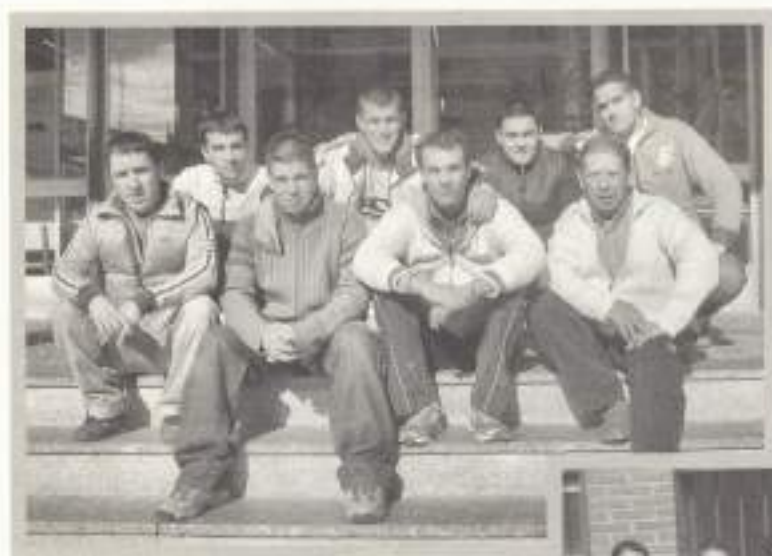
Equipos Electrónicos de Consumo.