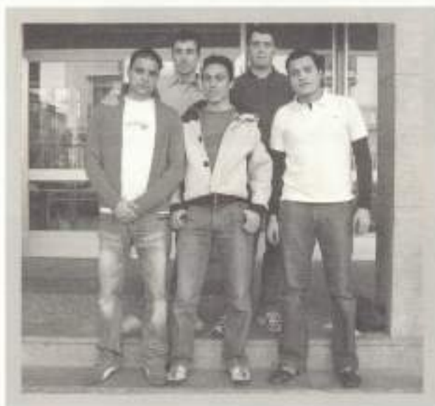
Sistemas de Regulación y Control Automáticos.