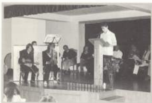
Discapacidad y literatura.