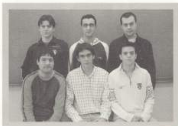
Sistemas de Telecomunicación e Informáticos.