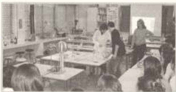
En torno al electrón en el laboratorio.