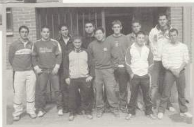
Equipos e Instalaciones Electrotécnicas.