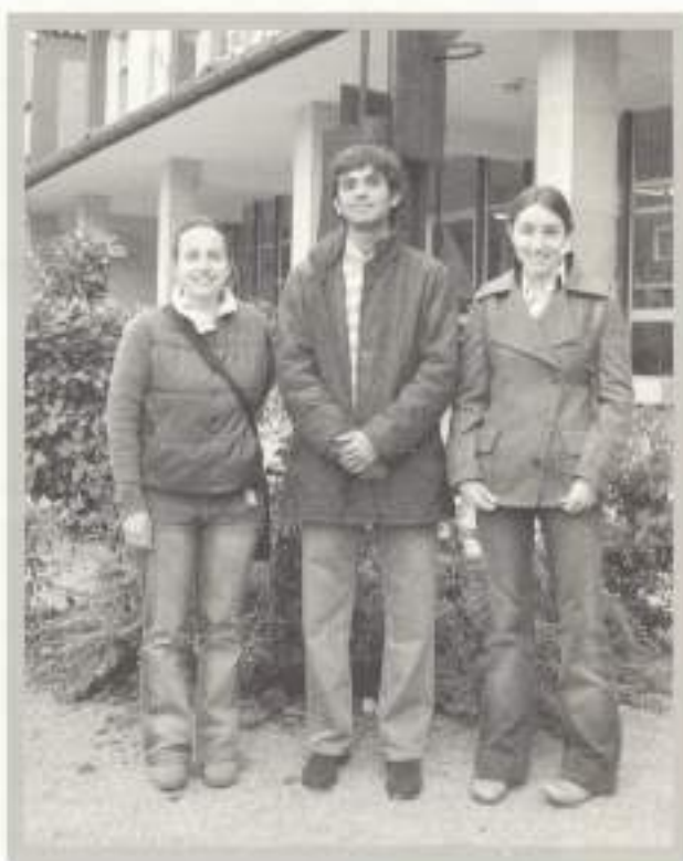
Realización y Planes de Obra.