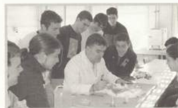
Disección en laboratorio.