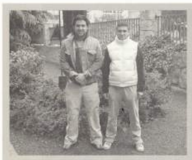
Producción por Mecanizado.