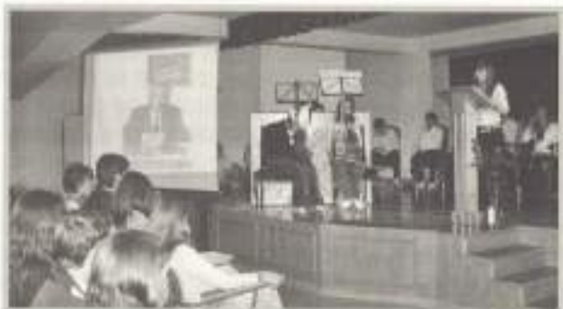
Homenaje a Leopoldo de Luis y Mozart.