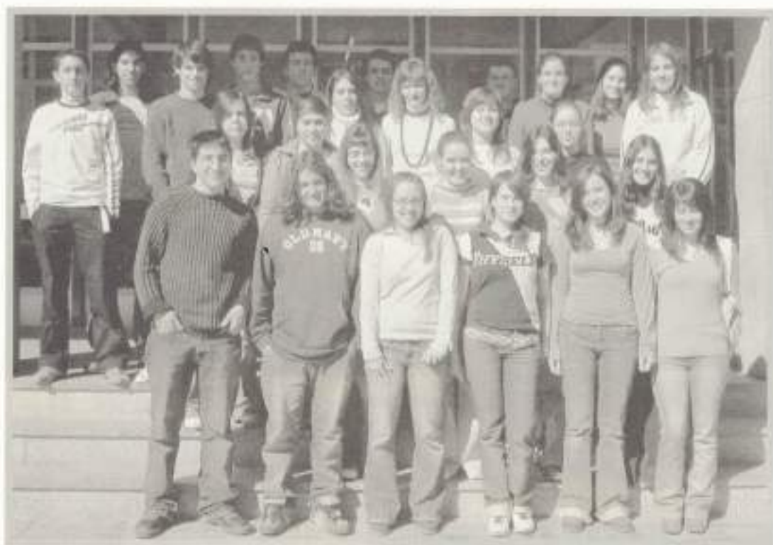
2º A Bachillerato.