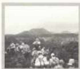
Sobre estas líneas, a la izquierda, Concierto en Eyipantla y, a la derecha, subiendo al volcán Parícutín.

hacia sentir culpable de adentrarte en ella y magullar la naturaleza con tus pisadas (San Martín de Tuxtla). Experiencias en las que, tras doce horas de marcha sobre lava con ocho kilos a la espalda, te sientes feliz de que te quedaran fuerzas para llevar los otros ocho kilos de la mochila de un compañero agotado. Sientes que una tienda de campaña, medio inundada por un aguacero tropical, es el mejor sitio para dormir, y que, con apenas dos camisetas y dos pantalones, puedes vivir el mejor mes y medio de tu vida.