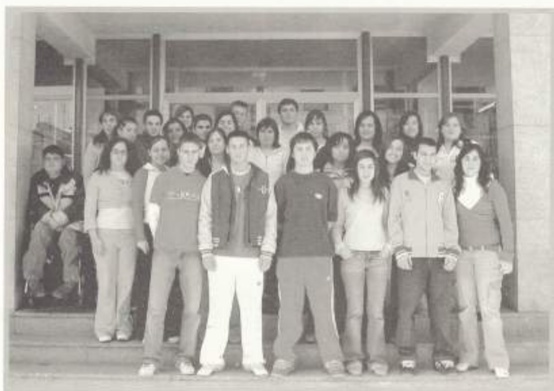
2º B Bachillerato.