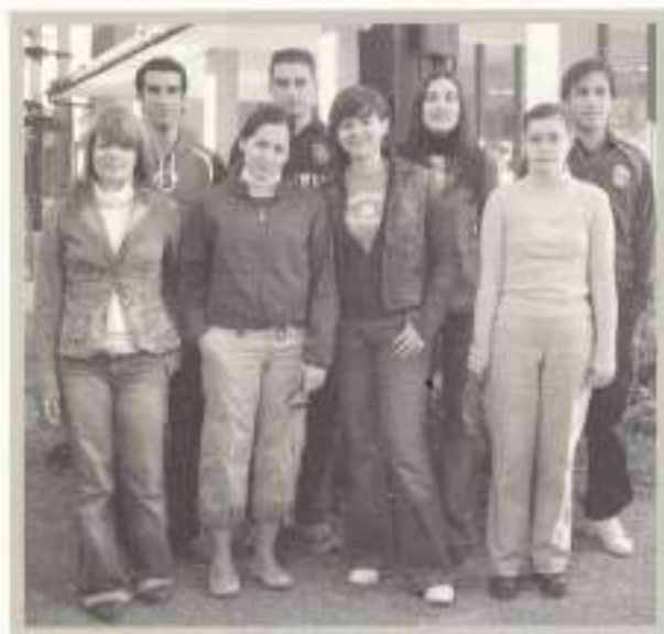
Desarrollo y Aplicación de Proyectos de Construcción.