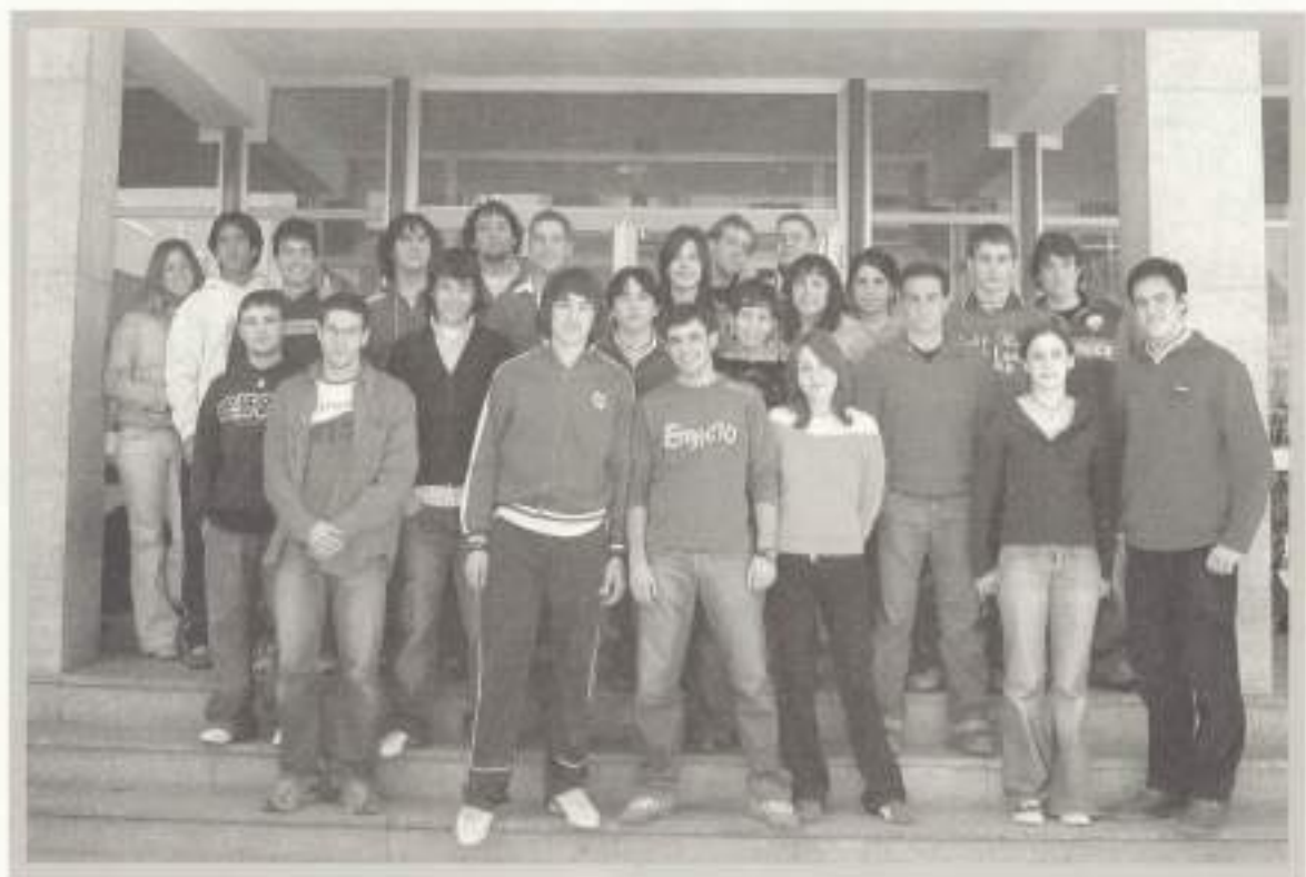
2º D Bachillerato.